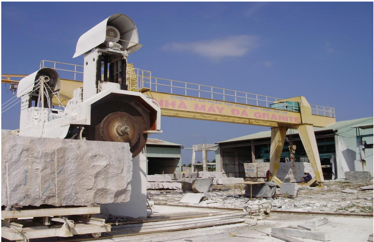
Thông tin chung:

Với lợi thế được cấp nhiều mỏ đá Granite, đá Bazan trạ, đá Bazan khối có trữ lượng và chất lượng cao trên địa bàn các tỉnh Tây Nguyên; những mỏ đá này đều ở vào những vị trí thuận lợi cho việc khai thác và vận chuyển, đảm bảo cho Công ty thu được lợi nhuận vượt trội.